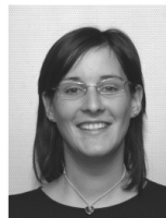
Responsabile Gruppo competizione

La stagione è ancora intensa e lunga e quindi auguriamo a tutti "In bocca al lupo". Un grande saluto a tutti coloro che fanno parte del nostro Sci Club, una grande famiglia.